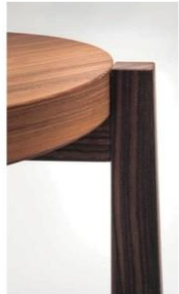
In questa pagina in alto, Una Stanza di Antonio Aricò per Editamateria. Foto Lorenzo Pennati; sotto, by Antonio Aricò per Editamateria, da sinistra, sedia povera e sediolina. Foto Andrea Basile. Pagina accanto, allestimento di Una Stanza (997 Architecture), nell'ex deposito ferroviario di Ventura Centrale, foto Lorenzo Pennati.